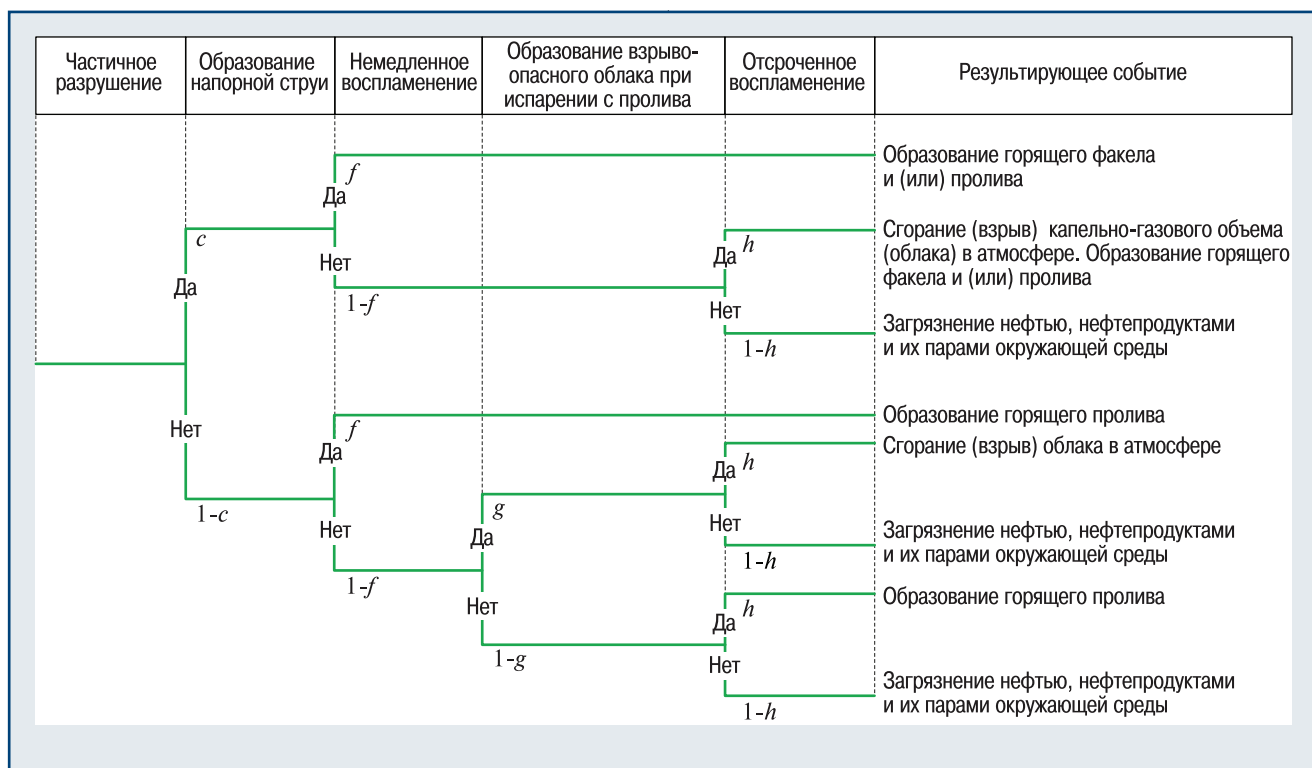
▲ Рис. 1. Дерево событий при разгерметизации подземного участка МТ с нефтью, нефтепродуктом

тинного разрыва трубопровода) и все возможные исходы аварий на основе дерева событий, пример которого для МН представлен на рис. 1 [14].