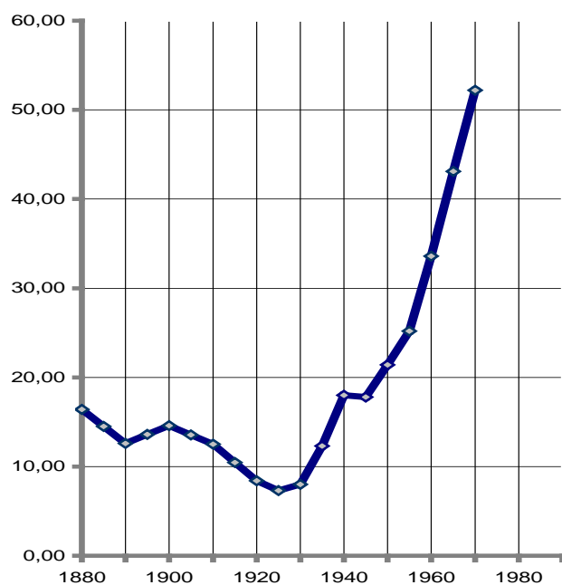
Рис. 2. Динамика металлического фонда Российской империи и СССР относительно металлического фонда США, %