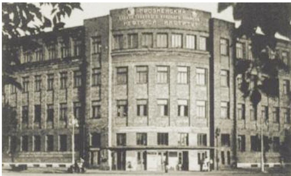
Грозненский нефтяной институт в 30-е годы XX в.