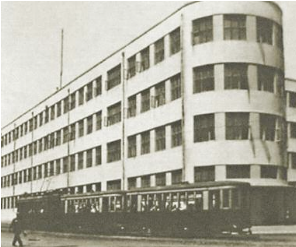
Азербайджанский индустриальный институт в 30-е годы XX в.

вредительской организации в нефтяной промышленности Азербайджанской ССР» было арестовано более 300 человек. Серьёзные проблемы в нефтяной отрасли, которая в силу объективных причин допустила срыв плановых заданий пятилетки, чекисты увязали с активизацией широкомасштабных «вредительских действий».